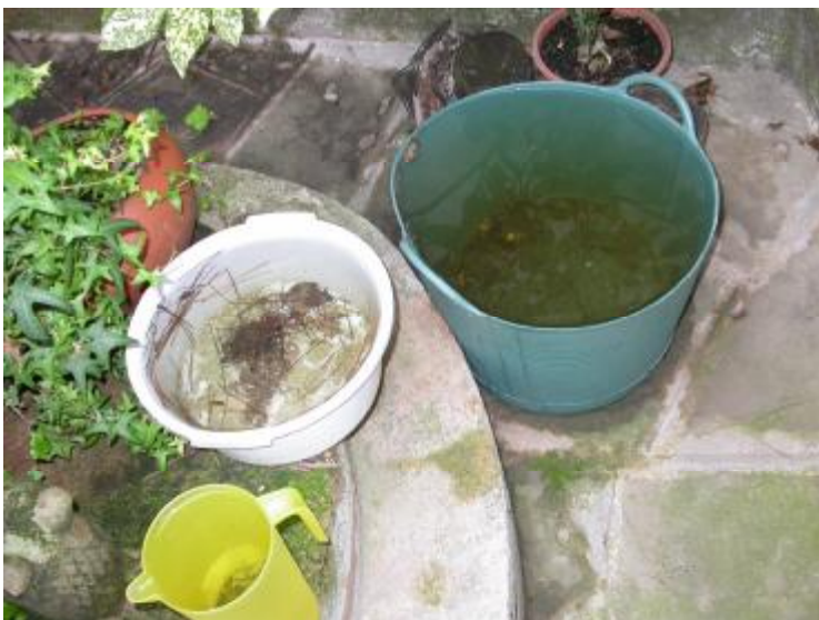
Descripció: Punts de cria estan en l'interior de propietats

Aquesta espècie és summament molesta perquè és agressiva i diürna, cria molt a prop de les persones perquè les seves aigües de cria són petits recipients, molt abundants als domicilis. Per tot plegat pot afectar molt la qualitat de vida de la ciutadania, no només a casa seva sinó també a instal·lacions públiques com ara els cementiris, on l'abundància de gerros de flors en sol facilitar una elevada proliferació. Addicionalment, aquesta problemàtica s'agreuja en relació amb el control d'altres espècies donades les dificultats de la intervenció administrativa en l'àmbit privat on hi ha possibilitat d'haver-hi larves del mosquit. S'estima que al Baix Llobregat aproximadament el 70% dels punts de cria estan en l'interior de propietats, trobant-se la resta en els embornals de la via pública.